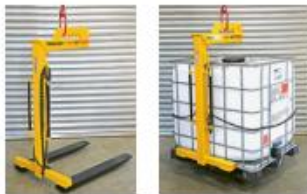
2 Die Ausbildung soll mit Anschlag- und Lastaufnahmemitteln durchgeführt werden, die auch im Arbeitsalltag zum Einsatz kommen.