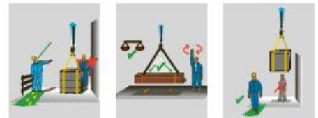
4 Richtiges Verhalten beim Anschlagen von Lasten