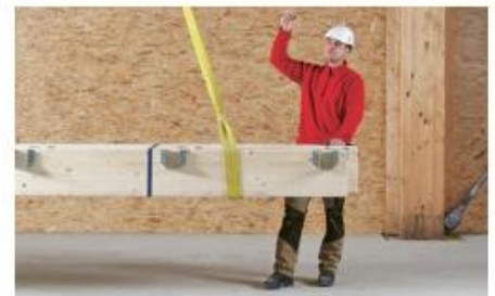
1 Die Ausbildung der Anschläger und Anschlägerinnen soll im gewohnten Arbeitsumfeld stattfinden.

Beim Anschlagen von Lasten ereignen sich immer wieder schwere Unfälle. Deshalb dürfen nur ausgebildete Personen Lasten an Kranen anschlagen. Verantwortlich für die Auswahl und Ausbildung der Personen sind die Arbeitgeber.